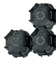
0313 01 (przykład połączenia)